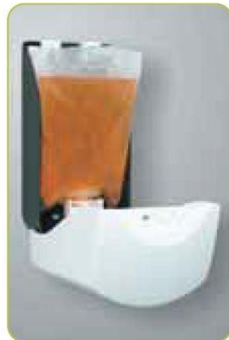
Einwegbeutel und Pumpe